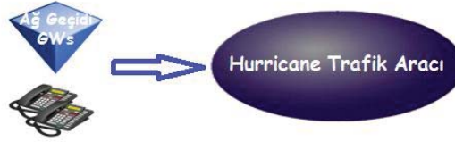
Şekil 5. Hurricane aracının simüle ettiği yapı

Bu çalışmada verilen test stratejisine ve yeni yaklaşımlara, plan aşamasında olan test otomasyonunun da eklenmesiyle daha etkin hale gelecektir. Bu konuda çalışmalara başlanmıştır.