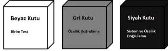
Şekil 2. Birim test, sistem ve özellik doğrulama

göre şelale (waterfall) [3] veya çevik (agile)[4] proje yönetim teknikleri uygulanmaktadır.