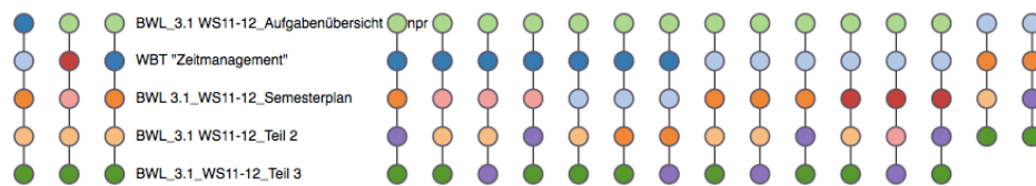
Abbildung 2: häufige Pfade der Länge 5, mit farbkodierten Lerninhalten

Die zweite Fragestellung kann mit Hilfe der LeMo-Analyse „häufige Pfade (BIDE-Algorithmus)“ angegangen werden. Bei einem Support von 80% ergibt sich folgendes Bild: