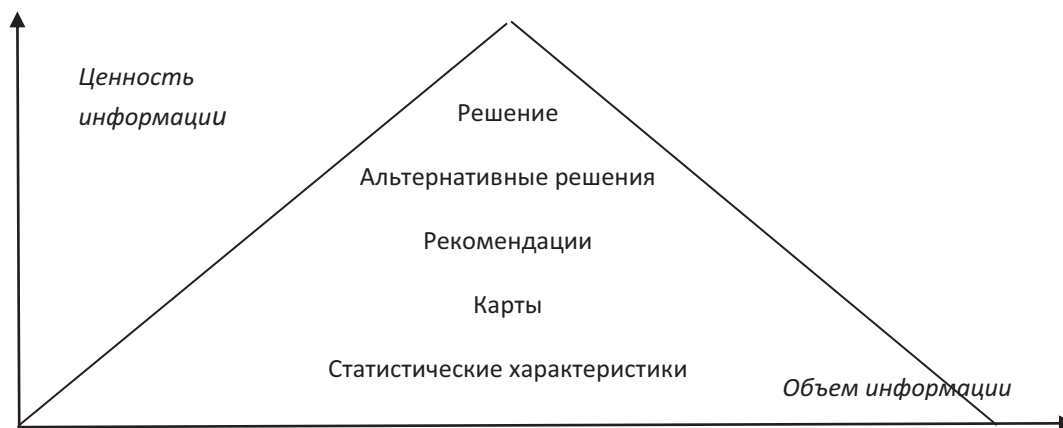
Рис. 2. Увеличение ценности и уменьшение объемов информации

Чтобы выстроить такую схему обработки данных (см. рис.1), сейчас требуется выполнить много этапов. При этом образуются промежуточные массивы и базы данных, которые находят своих пользователей. Стоимость их создания намного выше, чем стоимость хранения, поэтому они оформляются как самостоятельные массивы и базы данных и передаются в Государственный фонд на хранение. В зависимости от имеющегося опыта использования данных в каждой организации создаются свои структуры хранения данных.