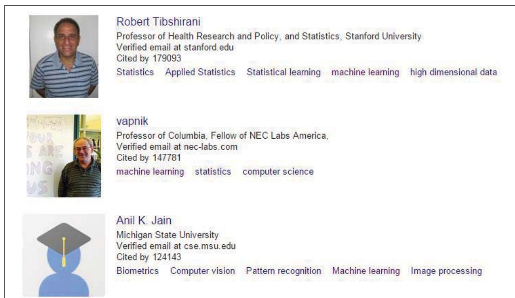
Рис. 1. Интерфейс страницы сервиса Google Scholar Citations

В этой работе представляется подход к созданию модели предметной области (искусственный интеллект) на основе зондирования большой информационной сети. Как такая сеть рассматривается сеть понятий, которые отражаются в тегах наукометрического сервиса Google Scholar Citations ( http://scholar.google.com/citations ). На рис. 1 приведен фрагмент интерфейса страницы сервиса Google Scholar Citations, соответствующий заданному заранее тегу machine_learning (машинное обучение).