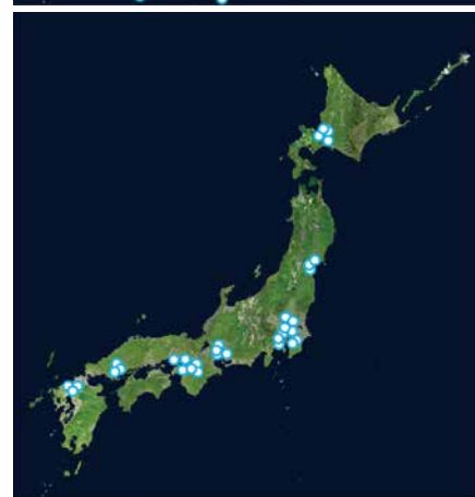
観測イメージ(上:通常の観測 下:特定地点観測) A visualization of how GOSAT-2 conducts observations (Top: Normal observation; Bottom: Target-point observation)