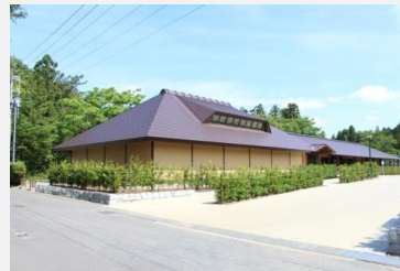
金ヶ崎要害歴史館