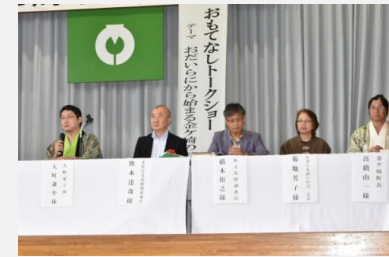
おもてなしトークショー