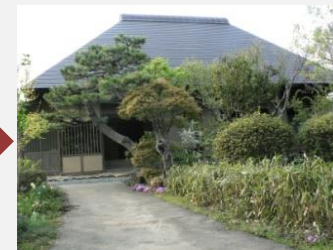
伊東家侍住宅(個人宅/現在,飲食店)