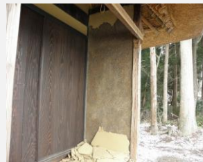
東日本大震災の被害