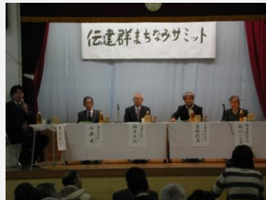
伝建群まちなみサミット