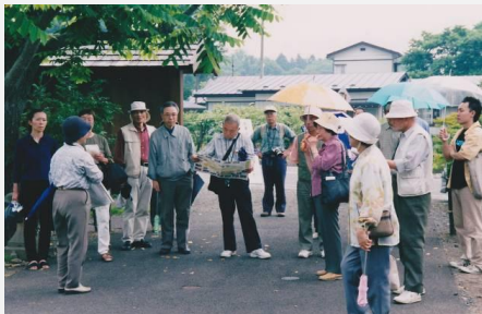
地区住民によるガイド