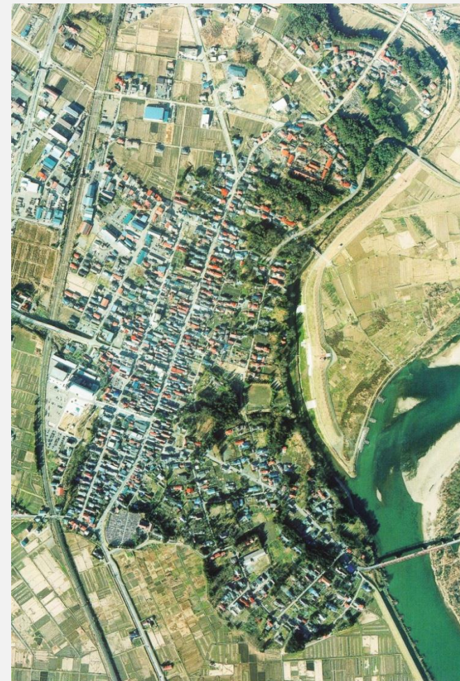
城内諏訪小路地区航空写真(平成8年12月撮影)