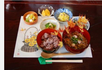
郷土食「ずるびき」の商品化