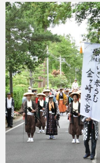
国選定15周年事業 いざ,参らむ! 金ヶ崎要害