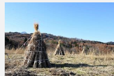
千貫石茅場(ふるさと文化財の森)