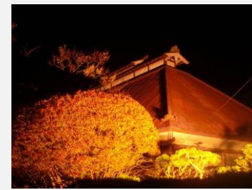
伝建地区ナイトツアー