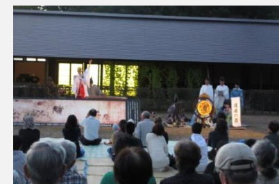
金ヶ崎要害歴史館「お月見コンサート」