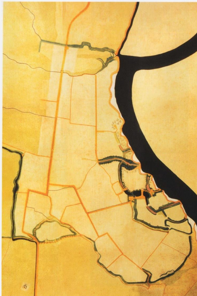
金ヶ崎要害屋敷惣絵図(宮城県図書館蔵/貞享年間か)