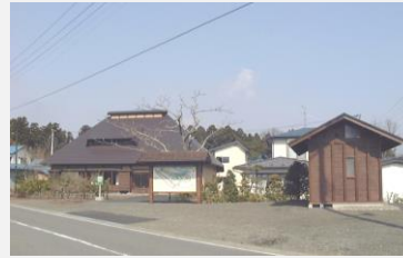
白糸まちなみ交流館,案内板