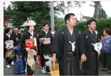
金ヶ崎の花嫁行列(むがさり)