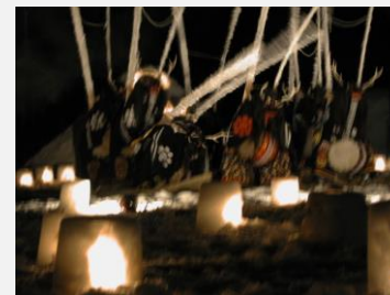
伝建群まちなみサミット前夜祭 雪灯籠と奥野流富士麓行山北方鹿踊