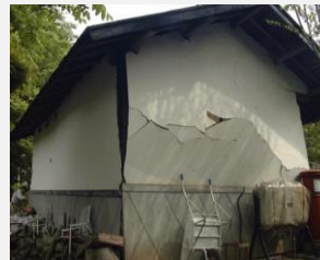
宮城県沖地震の被害