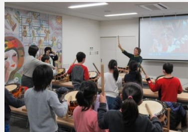
ふるさと教育・祭り「囃子」の学習