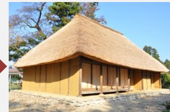
土合丁・旧大沼家侍住宅