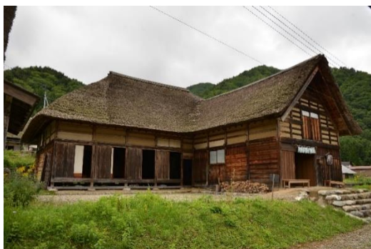
【前沢曲家資料館外観】