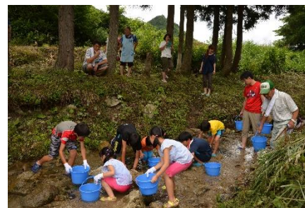
【イワナつかみどり】