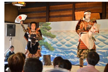
【田島祇園祭屋台歌舞伎上演】