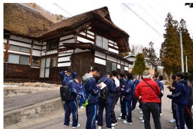
【案内人によるガイドの様子】