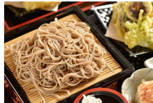
【そば処曲家のそば】