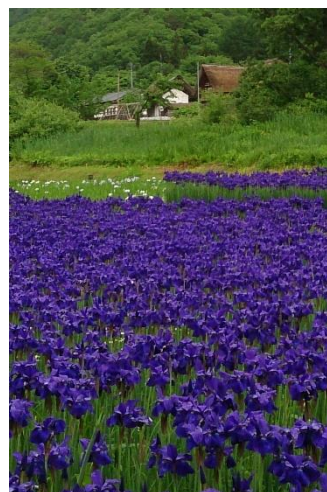
【前沢ふるさと公園のアヤメ】