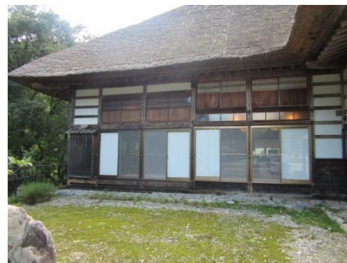
【そば処曲家のアルミサッシュ】