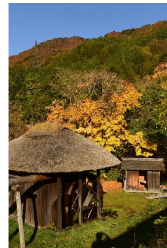
うつくしまの音30景に選定 【水車とバッテリー小屋】