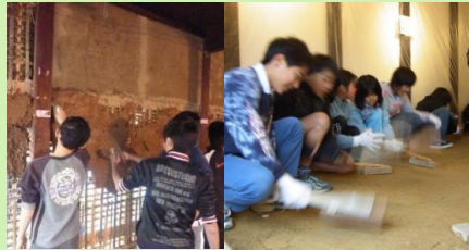
小学生の伝統工法体験 (荒壁塗り・土間たたき)