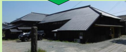
旧八女郡役所の再生・活用