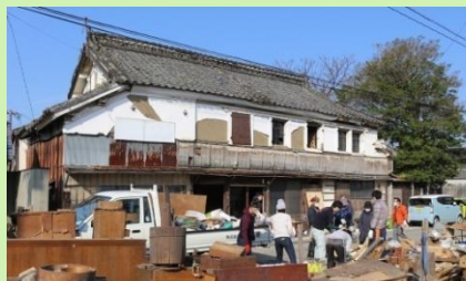
空き家の活用支援 (空き家の大掃除ワークショップ)