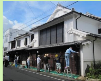
町家のメンテナンス支援 (柿渋塗りワークショップ)