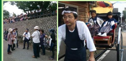
町並みのイベント支援 (町並み案内・人力車運行)