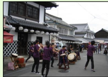
町並みイベントの支援 (町屋まつり)