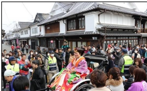
(結婚式～おひなさまパレード～)

9月には、地区内の福島八幡宮の境内で、重要無形民俗文化財「八女福島の燈籠人形」が公演されるのに合わせて、「八女のまつり、町屋まつり」が開催され、伝統工芸の技術や保存地区の魅力の発信が行われている。