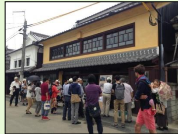
町並みの広報活動 (修理が完了した建物の見学会)