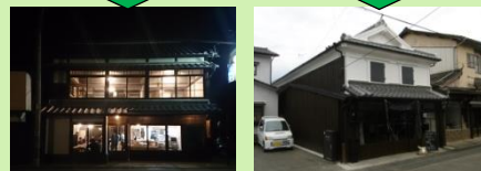
空き町家の再生・活用