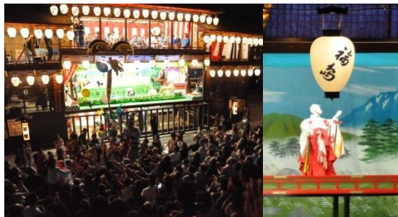
(八女福島の燈籠人形)

9月には、地区内の福島八幡宮の境内で、重要無形民俗文化財「八女福島の燈籠人形」が公演されるのに合わせて、「八女のまつり、町屋まつり」が開催され、伝統工芸の技術や保存地区の魅力の発信が行われている。