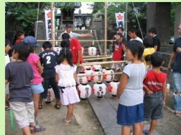
伝統行事の復活の取組み (天神さんこどもまつり)