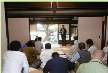
伝統工法の研修会の開催