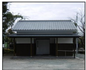
来訪者用トイレ整備