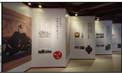
情報発信施設の整備(造り酒屋跡の取得・整備)