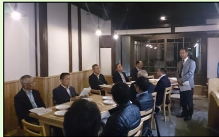
町家の活用支援 (新規オープン店舗のお披露目会)