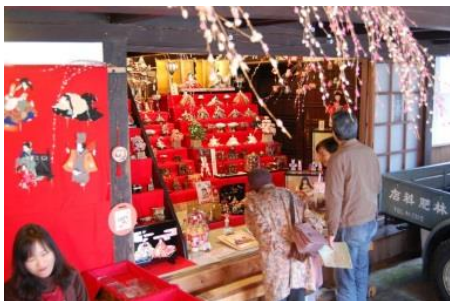
筑後吉井おひなさまめぐり