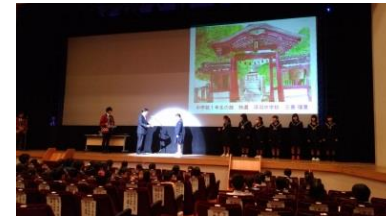
町並み絵画コンクール 表彰式