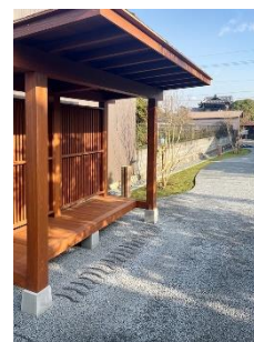
休憩所・東屋整備