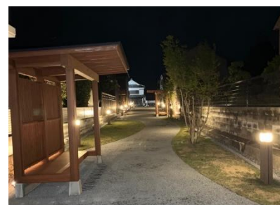
遊歩道整備(ウォークابل)