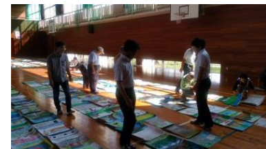
町並み絵画コンクール 審査会