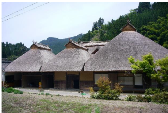
国指定重要文化財 平川家住宅 凹型寄棟造の茅葺住宅 (一般公開)