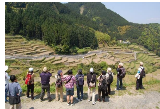
森林セラピー (日本棚田百選「つづら棚田」)