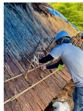
茅葺ワークショップ