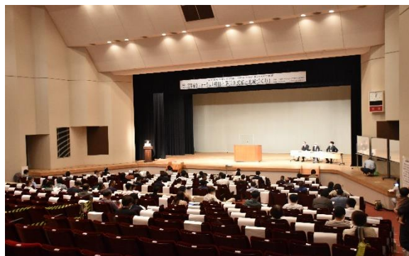
茅葺フォーラムinうきは