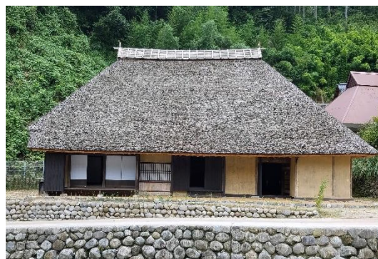
滞在型交流施設「注連原住宅」 宿泊施設として、地域団体に指定管理運営