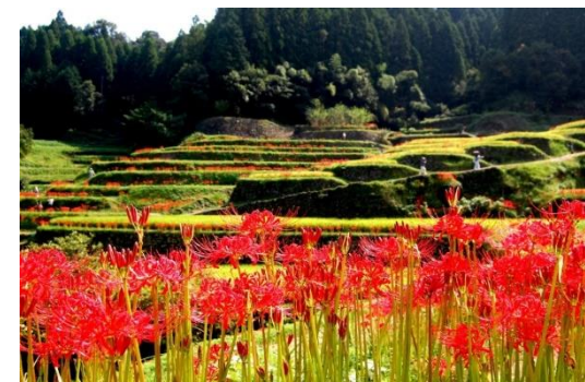
彼岸花めぐり (日本棚田百選「つづら棚田」)