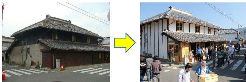
高久家住宅の整備・公開