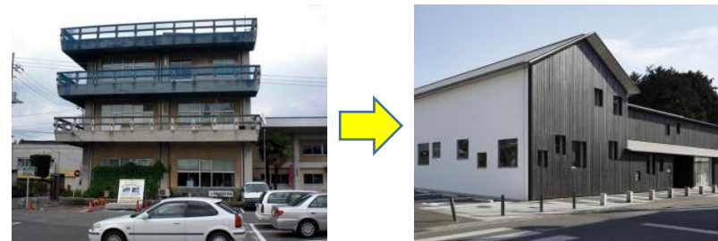
景観阻害建物の撤去と真壁伝承館の整備