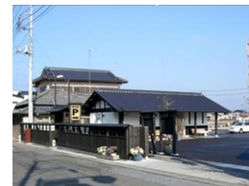
観光駐車場の整備