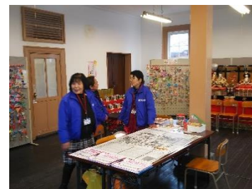
整備した旧真壁郵便局