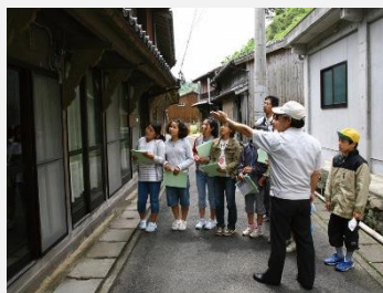
小学生の郷土学習