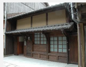
街なみ環境整備 (公衆トイレ)