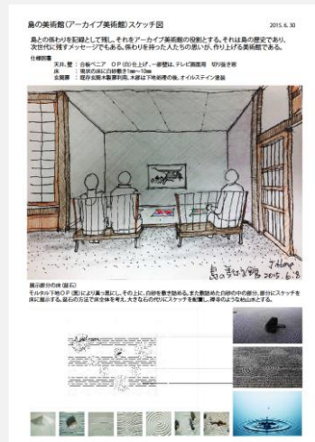
大学連携事業 「島の美術館」