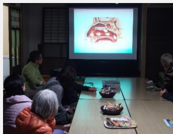
スギ花粉避粉地体験セラピーツアー