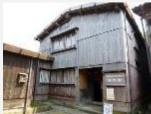
公開民家「清九郎」 平成3年公開