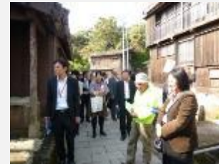
住民による観光ガイド