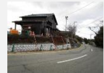
歩行者の安全を確保するための歩道整備工事