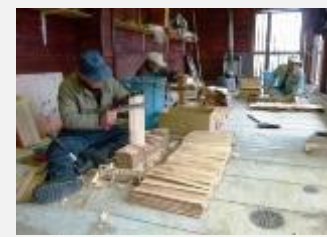
住民による木羽へぎ作業