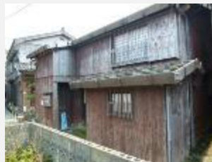
公開民家「金子屋」 平成3年公開