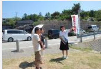
地元中学生による観光ガイド

平成29年5月には日本遺産「荒海を越えた男たちの夢が紡いだ異空間～北前船寄港地・船主集落～」の認定を新たに受け、宿根木のほか、寄港地である佐渡市小木町の歴史遺産(鎮守である木崎神社、湊を描いた絵図、船乗りが奉納した船絵馬等)を含め、千石船で繁栄した往時の歴史的景観の保全に努めている。