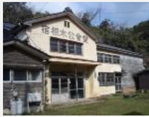
宿根木公会堂 平成27年公開