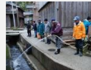
地区を守る放水訓練