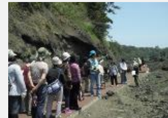
地質を学ぶジオパークガイド