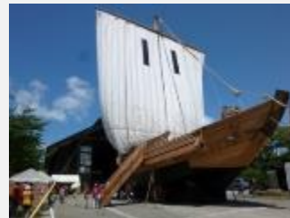
平成10年(1998)に復原され、佐渡国小木民俗博物館に展示されている千石船「白山丸」