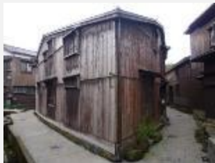
公開民家「三角家」 平成24年公開