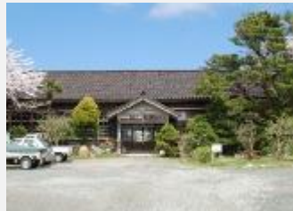
佐渡国小木民俗博物館 昭和47年開館