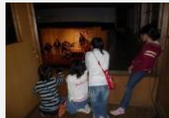
住民による青年芝居