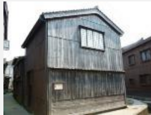
中島土蔵 平成24年公開