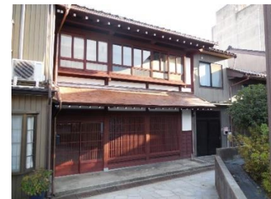
[ 修理後 ]