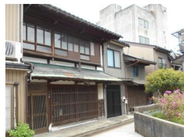
[ 修理前 ]