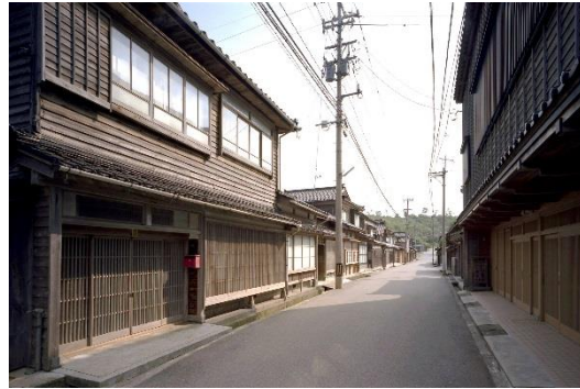
街道沿いの町並み