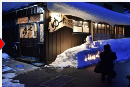
修理後(店舗として活用)