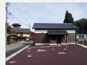
駐車場と便益施設