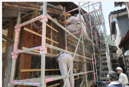
旧旅籠若狭屋の改修ワークショップ