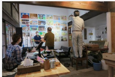
小学生の町並み絵画展