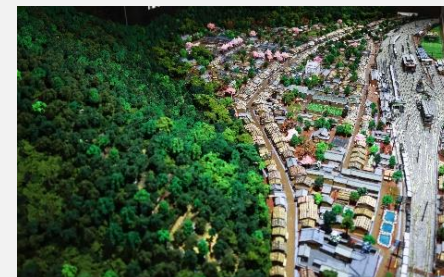
今庄宿のジオラマ