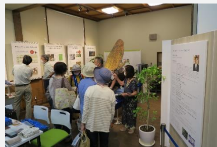
ヤシャゲンゴロウ資料展示室