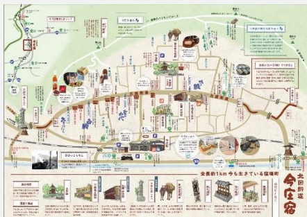
今庄宿ガイドブック