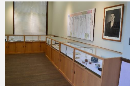
田中和吉資料展示室