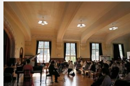
昭和会館でのクラシックコンサート