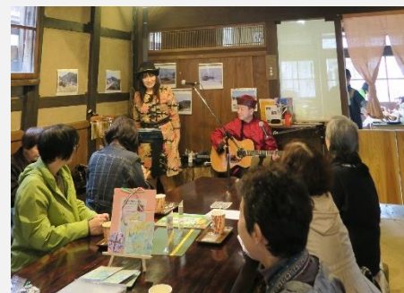
旧旅籠若狭屋でのコンサート