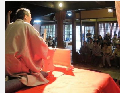
旧旅籠若狭屋での落語