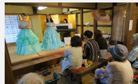
旧旅籠若狭屋でのコンサート