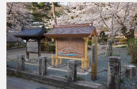
今庄宿伝建案内看板の設置