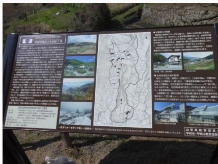
重伝建地区の説明板

見学ルートを設定することにより、日々生活されている住民のプライバシー保護を図りながら、保存地区内の魅力を伝え、快適に散策していただくことが可能となった。