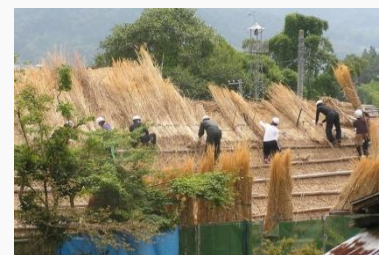
茅葺きワークショップ