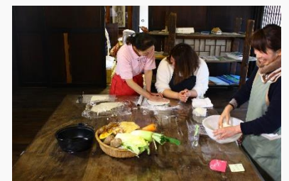
情報館でのほうとう作り体験