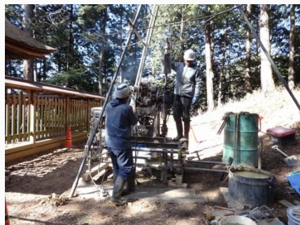
ボーリングによる地質調査

令和5年10月には、地区内の道幅などを考慮し、小型軽量の消防用ポンプを導入した。