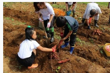
さつまいも収穫祭