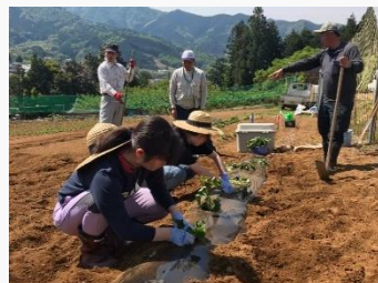
さつまいも苗植え付け