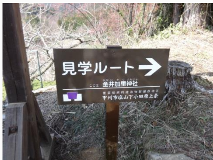
見学ルート誘導板