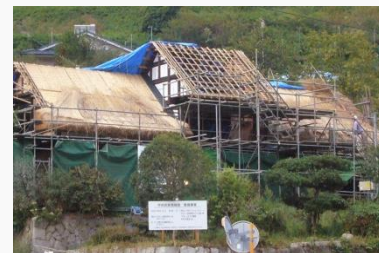
工事中の甲州民家情報館