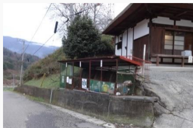
景観改善事業 実施前