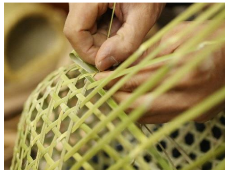
保存地区内で製作・販売がされている伝統的工芸品「戸隠竹細工」