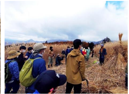
茅刈りワークショップの様子