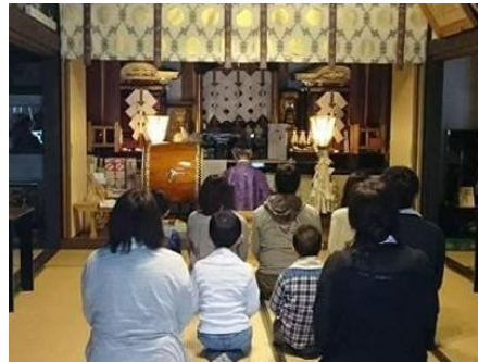
祈りの場である宿坊の神殿