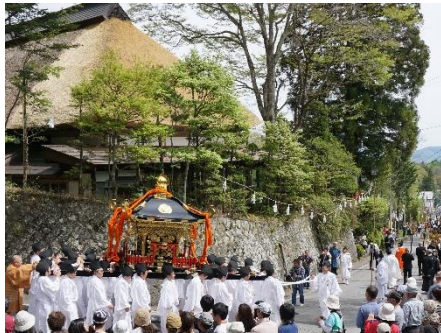
戸隠神社式年大祭と宿坊

戸隠には今も参拝者を迎え入れる宿坊が30軒以上あるほか、戸隠神社式年大祭をはじめとする伝統的な祭礼の舞台として、伝統的な「戸隠竹細工」の制作・販売の場として、伝統的建造物やその周辺が活用され続けている。本来の活用方法が継承されているのと同時に、最近では伝統的建造物がコンサート会場や結婚式場としても活用されている。また、重伝建選定により、修理に携わる職人(大工・茅葺等)や建築士がまちづくり活動へ積極的に参画するようになってきている。