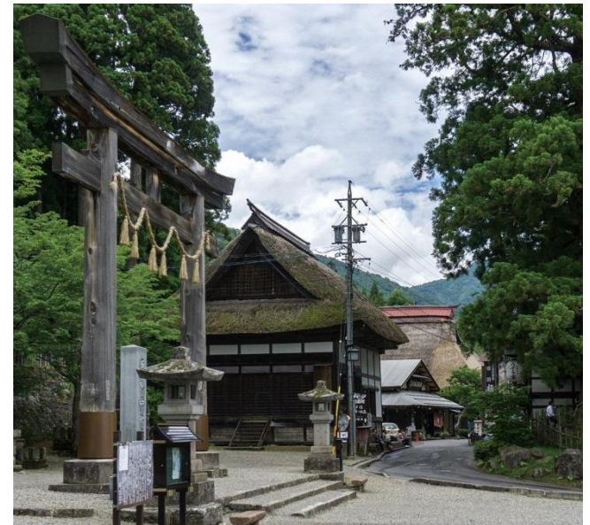
中社鳥居前から横大門通りの町並み

長野市戸隠伝統的建造物群保存地区は山岳修験と深く結びついた戸隠信仰を背景として標高1,000mを超える高地に成立、発展した信仰集落で、江戸時代以来の地割を良く残しており、戸隠神社中社及び同宝光社それぞれの社殿を基点とする参道沿いに大規模な宿坊が屋敷を構え、その外縁に農家、商家等からなる門前町が広がる。保存地区内には江戸時代中期から昭和までに建築されたせがいで造を特徴とする茅葺屋根の伝統的建造物が多く残されており、戸隠神社社殿や石塔、石燈籠、神木等の工作物・環境物件とともに歴史ある信仰集落としての町並みを良く伝えている。