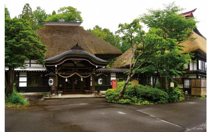
江戸時代の姿を伝える茅葺屋根の宿坊