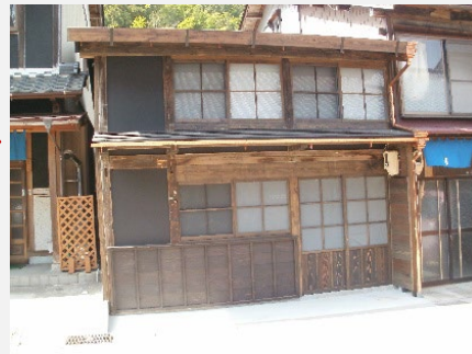
平成29年度住宅の修理前後