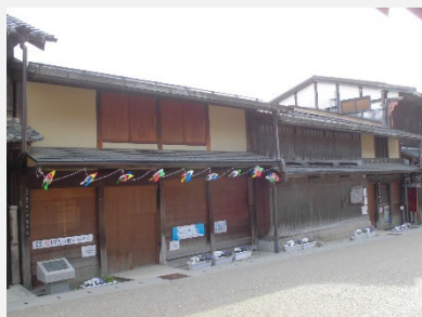
市指定文化財勝川家