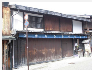
市指定文化財土佐屋