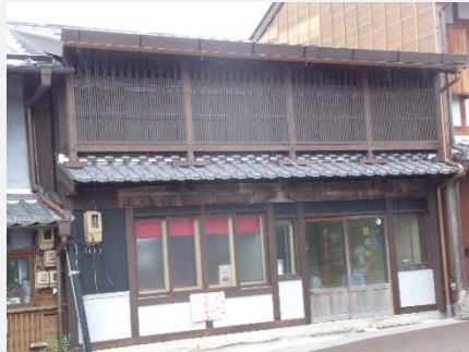
平成24年 ゲストハウス