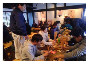
ミニ茅ニューづくり