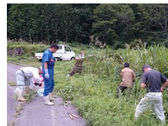
大ハンゴン草の除去作業