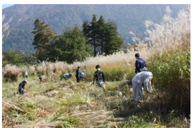
白川郷学園茅刈り作業