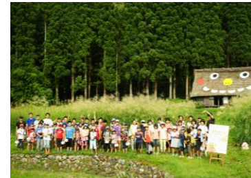
ゴブリンアートプロジェクト