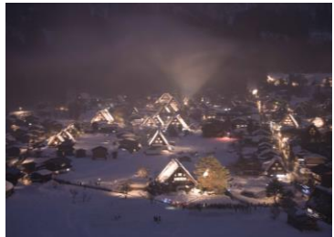
冬のライトアップ