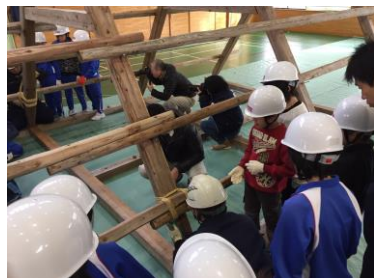
合掌造り小屋組み組み立て授業(地域の職人さんから伝統技術を学ぶ)