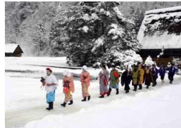
伝統芸能の継承(春駒)