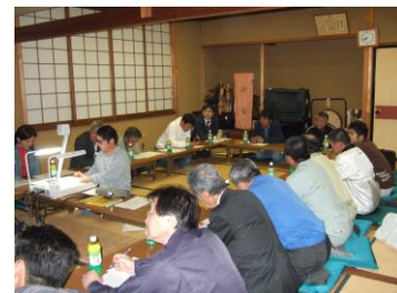
毎月開催の定例会

昭和46年から保存活動をスタートした先人先輩方。昭和51年の重伝建選定を追い風に、住民が力を合わせて合掌家屋を守ってきました。それが世界遺産登録につながり、多くの人々が訪れる地となりました。私たちはこの合掌集落に生活できることを誇りに、先人や今を生きる住民、ご支援くださる行政・有識者をはじめとする全ての方々への感謝を忘れず、次代を担う子どもたちに胸を張ってつなげていけるよう努力を続けて参ります。