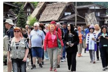
外国人観光客増加