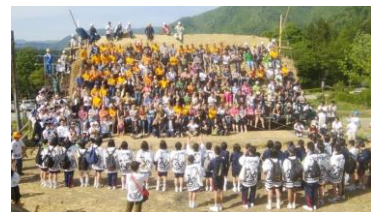
国際茅葺き会議への参画