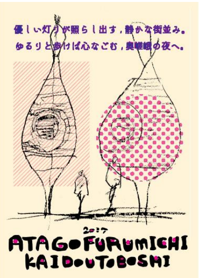
←H29年度の「愛宕古道街道灯し」チラシ

毎年、嵯峨鳥居本地区では、8月23日から25日の間に「愛宕古道街道灯し」が行われている。 この取組みは20年ほど前に、化野念仏寺灯供養への来訪者を迎え、また地元の地蔵盆を盛り上げるために古い町並みが残る街道沿いに、手作りの小さな行灯の灯りを点したのがはじまりである。この灯りは年々大きくなり、地元の美術大学や子供からお年寄りまで多くの方とつくる行灯が、今では大小800基ほど灯るお祭りになった。(大きなものは高さ10m近くにもなる)