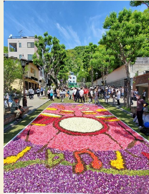
インフィオラータこうべ『北野坂』 市民ボランティアが花絵を作成 (毎年GW期間中に開催、約30万人が来訪)