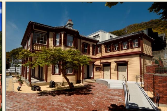
伝統的建造物／旧ドレウエル邸 (ラインの館)