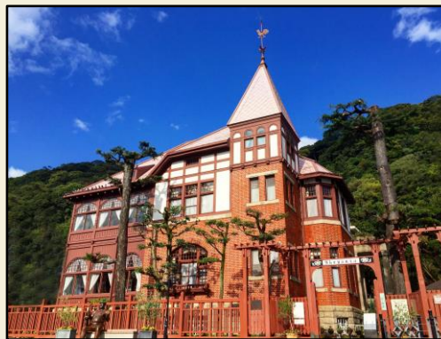
国重要文化財／旧トーマス住宅 (風見鶏の館)