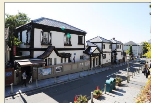
景観形成道路(北野通)