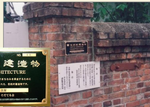
伝統的建造物の銘板設置