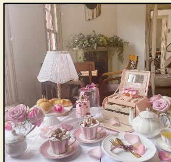
撮影スポットとして