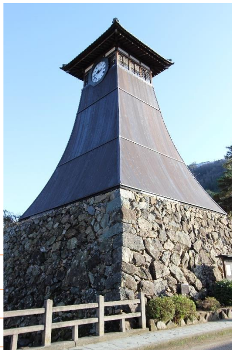
▲辰鼓楼(時計台)H29修理