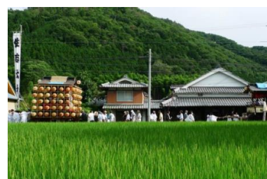
水無月祭(福住地区)