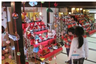
丹波篠山ひなまつり