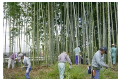
住民による竹林整備