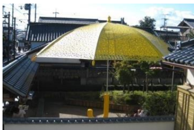
まちなみアートフェスティバル