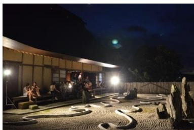
住吉神社ピアテラス