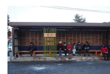
竹を活用したバス停修景