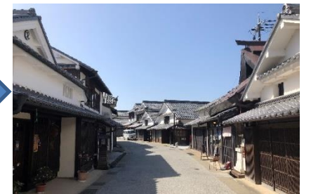
無電柱化後(篠山地区)