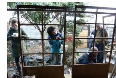
NPOによる古民家再生