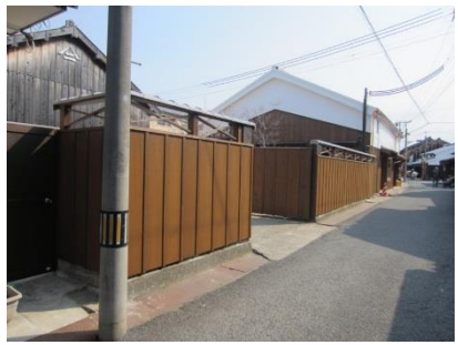
保存修理等による町並み景観の整備事例