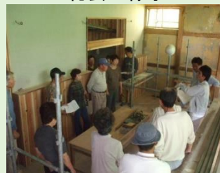
『甚風呂』活用方法の検討