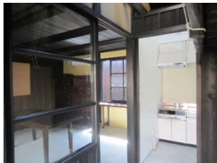
湯浅まちなみ交流館の整備