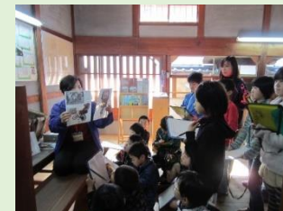
『甚風呂』での学習活動