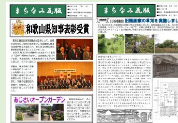
「まちなみ瓦版」の発行