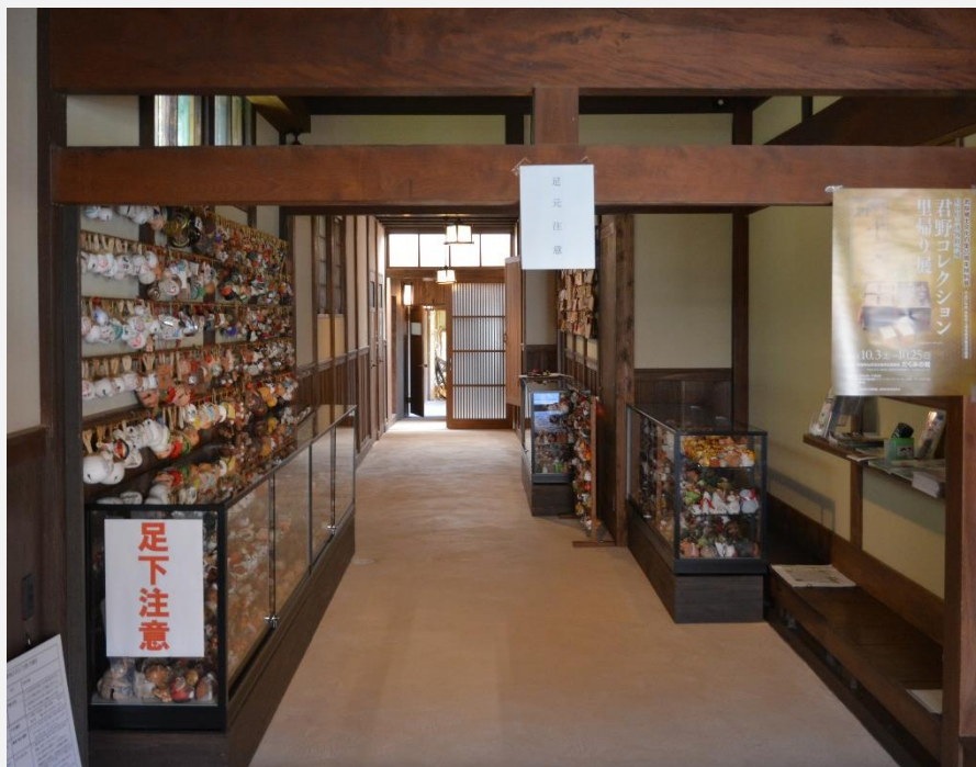
若桜民工芸館内部