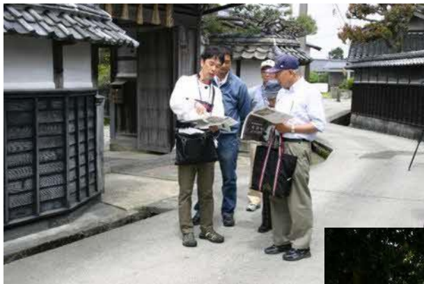
ボランティアガイド の活動の様子

活動としては、毎年春と秋に行われる国重要文化財「門脇家住宅」一般公開期間中と随時申込があったときに、見学者の人数に応じて地区内のガイドをして活動されている。