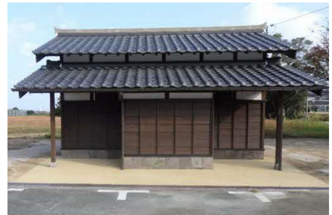
(伝建地区トイレ設置の例)