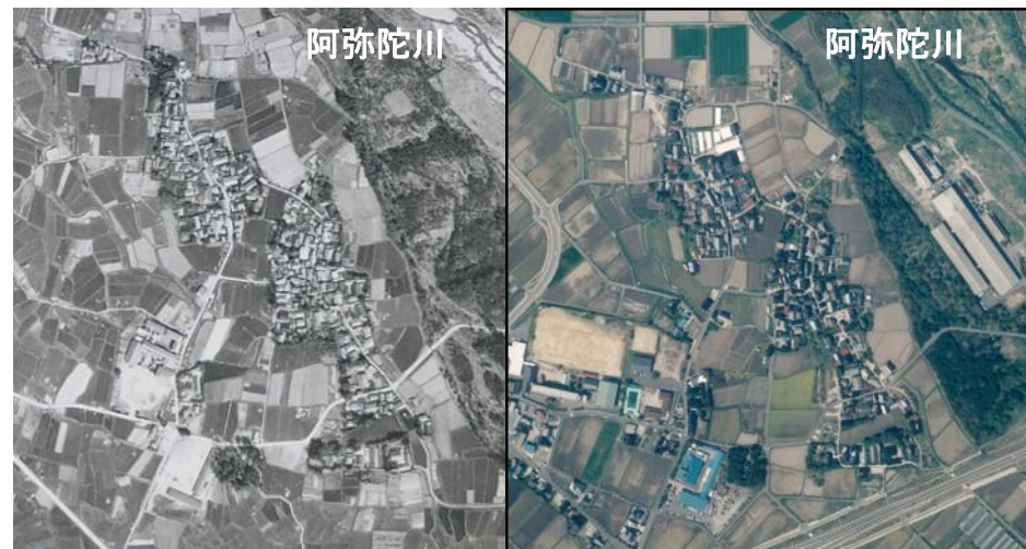
圃場整備前(昭和44年)