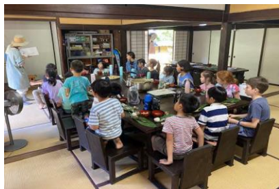
武家屋敷を活用して 放課後児童クラブ開設