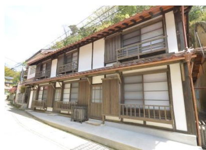
伝建物を利用した宿泊施設