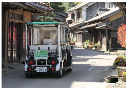
電動カートの運行