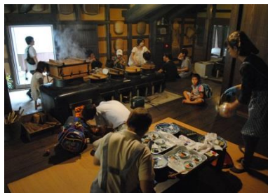
文化財建物と活用 「竈体験」重文熊谷家住宅