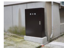
消火栓(温泉津地区)