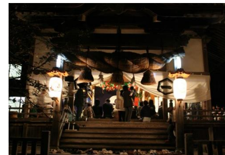
地区内の神社で行う夜神楽