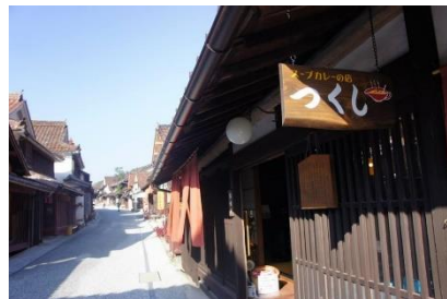
改修後飲食店をオープン

保存修理工事が終わった家屋の内装を改修し、店舗として活用を図ったり、空き家を古民家再生事業により、滞在型宿泊施設として整備しました。