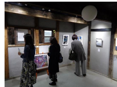
御手洗アートウォーク（令和2年～）