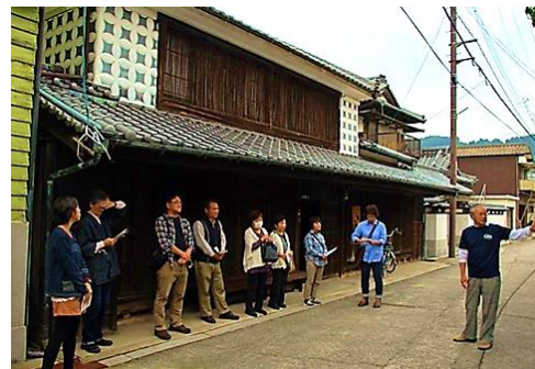
ボランティア観光ガイド（平成6年～）

今後も空き家の増加や文化財の活用など地域の抱えている課題について、行政と連携を図り取り組んでいく。