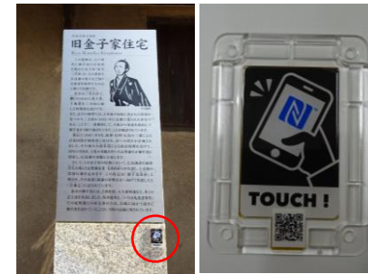
地区内案内板の多言語化対応