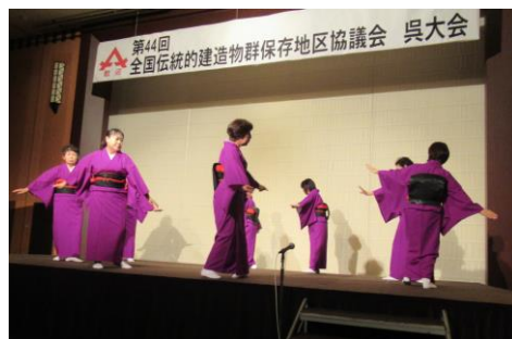
御手洗節の披露（令和4年）