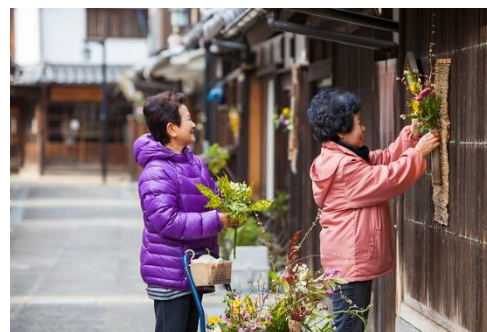
町屋に一輪挿し活動（平成15年～）