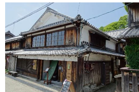
レストラン・宿泊