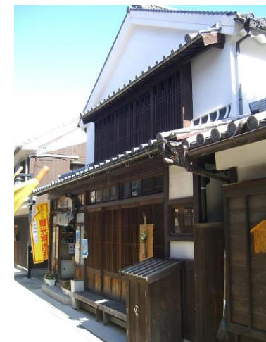
観光交流センター 潮待ち館 （平成12年～）