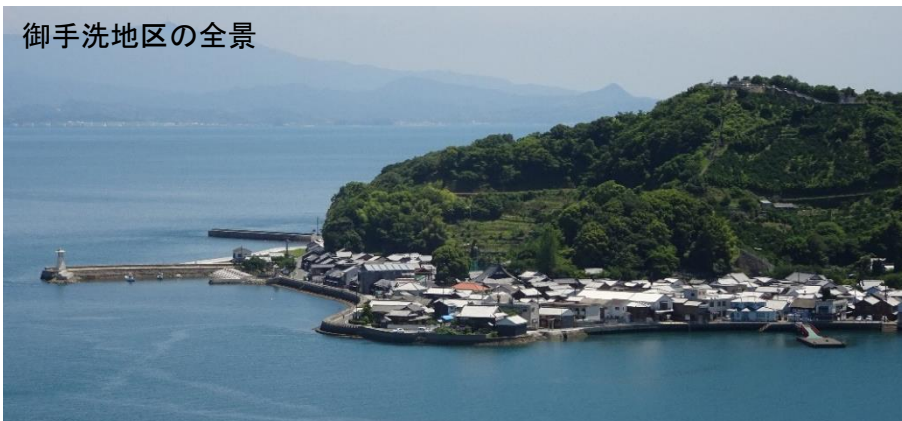
御手洗地区の全景

呉市豊町御手洗伝統的建造物群保存地区は、瀬戸内海のほぼ中央、芸予諸島の一つ、大崎下島にある港町である。北前船航路の要衝として栄えた町並みは、創生時の17世紀中頃から19世紀初期にかけて、港の発展とともに海岸が埋め立てられ、時代に応じて街区が変遷している。その中を、小路や路地等が網の目のように巡り、大小の町屋や商家、茶屋、船宿、神社、寺院などが混在している。建築形態では、間口が狭く奥行き長い妻入りの町屋と、棟割長屋に代表される平入りの町屋が多い。また、大正から昭和初期に建設された洋風建築も点在し、瀬戸内の潮待ち、風待ち港としての歴史的風致をよく伝えている。