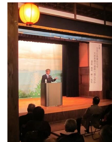
幕末維新の歴史講演会 （平成27・29年）