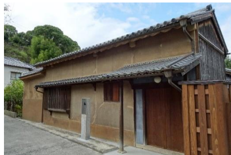
旧金子家住宅(平成31年)