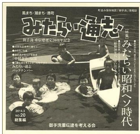
ミニコミ紙の発行 （平成8年～）