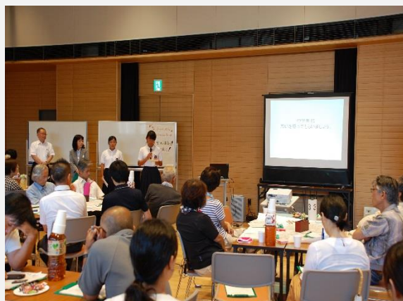
ワークショップ取組状況