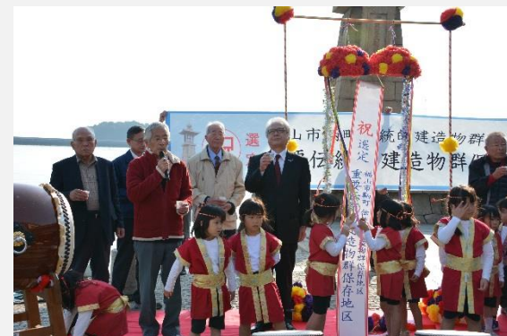
重伝建選定祝賀会