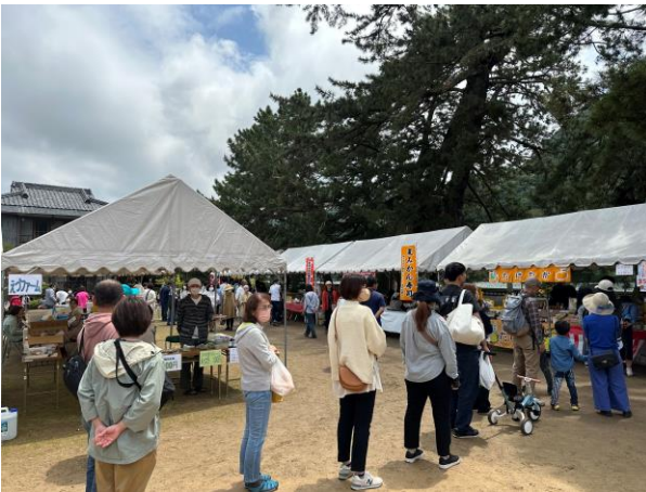
萩・夏みかんまつり(平安古)