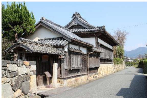
旧益田家物見矢倉

特徴 堀内は旧萩城三の丸にあたり、毛利輝元が慶長13年(1608)に指月山に城を築き、町割をおこなったことに始まる。保存地区は堀内のほぼ全域で、藩の諸役所(御蔵元・御木屋・諸郡御用屋敷・御膳夫所・御徒士所)と、毛利一門をはじめとする大身の武家屋敷が建ち並んでいた。近世城下町の武家屋敷としての地割が今もよく残り、土塀越しに見える夏みかんとともに歴史的風致を形成している。現在も、地区内には永代家老の益田家の物見矢倉など10数棟の武家屋敷が残る。