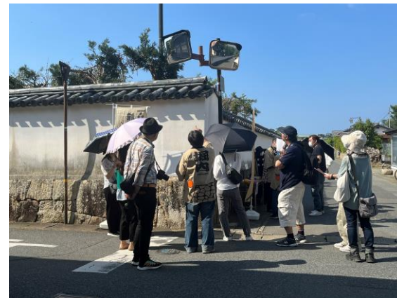
町内会の主催イベント 城下町萩・堀内散策