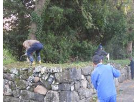
住民による清掃活動(堀内)