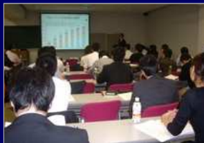
広報関連（講師アレンジ等）