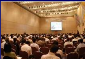
受託セミナー運営