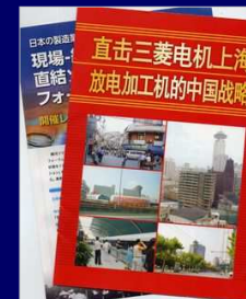
カタログ制作（紙、電子ブック）

貴社PRに必要な各種コンテンツの企画、構成、制作等を承ります。貴社の歴史や技術を一冊の本にまとめます。日ごろお使いいただく会社紹介等のカタログ、ホームページや動画等のコンテンツ制作、海外向けの翻訳サービス等をご提案します。