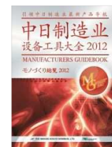
日中モノづくり総覧