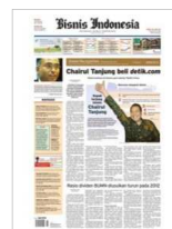
ビジネス・インドネシア