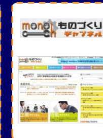
ものづくりチャンネル