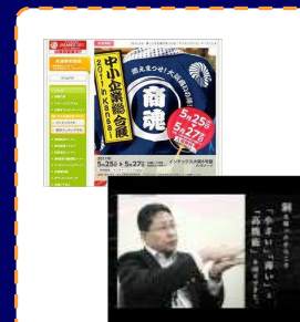
ホームページ、映像制作