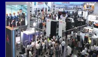
海外展示会の日本代理店機能