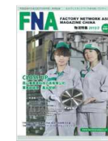
FNAマガジンチャイナ