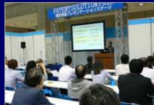
展示会受託／展示ブース運営

数々の主催展で培ったノウハウを基に、官公庁や自治体から受託した展示会の運営や子ども向けイベントを実施しております。また、セミナーの受託運営も行っており、ご要望を頂ければ、講師の派遣もいたします。