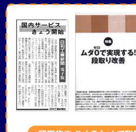
印刷物やイントラネットで利用