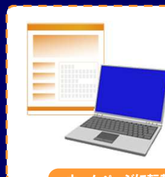
ホームページに転載

新聞や雑誌に掲載された記事を「自社のホームページに掲載したい」「チラシに使いたい」等のご要望に応えるサービスです。新聞記事等の多くは新聞社がその著作権を有しています。規定の手続きと使用料のお支払いにより、貴社のPRツールとして活用できます。