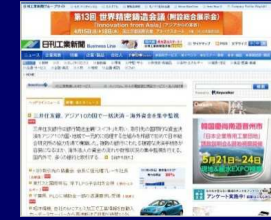
Business Line (ホームページ)