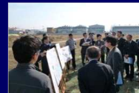
国内外視察ツアー