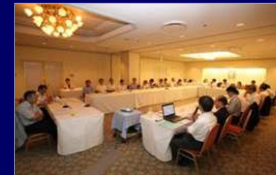
グリーンフォーラム