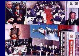
コピーサービス&amp;フォトサービス