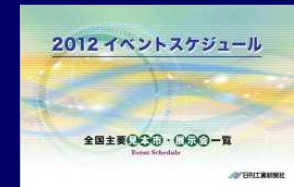
全国見本市・展示会一覧