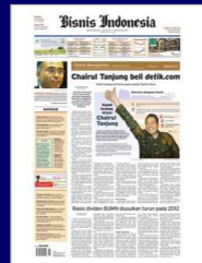
ビジネス・インドネシア