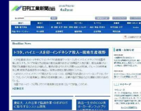
日刊工業新聞電子版