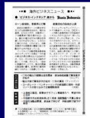
海外ビジネスニュース 日刊工業新聞の総合面(2・3面)に掲載