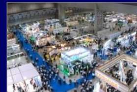
主催展示会・セミナー

ロボットやスマートグリッド、難加工、プラスチック、食品等の多様な切り口による「技術専門展」を開催。最新の業界事情や最先端の技術動向を入手できます。 一方で、子ども向けモノづくり啓発の展示会も実施。多角的な情報収集が可能です。 セミナーは技術系のものから経営全般にいたるまで、多種多様なテーマにて開催。 国内外での視察会も実施しています。 毎年12月発行「全国主要見本市・展示会一覧」も好評です。