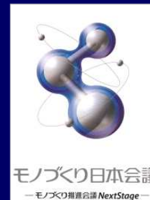
モノづくり日本会議

約1,900社の会員からなる、「モノづくり日本会議」。本会議ではモノづくりにかかわる各種検討会や研究会を開催しています。 これらを通じてロボットやエネルギー問題など、テーマに沿った最新動向や行政施策を知ることができます。 また「グリーンフォーラム21」では、環境の最新情報を国内外での環境視察・フィールドワーク・事例研究等により知ることができます。 それぞれ、会員として参加することにより、一歩先の戦略・CSRのヒントを得られます。