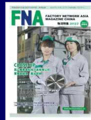
FNAマガジンチャイナ