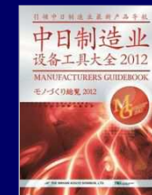
日中モノづくり総覧