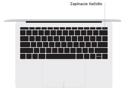
Force Touch trackpad