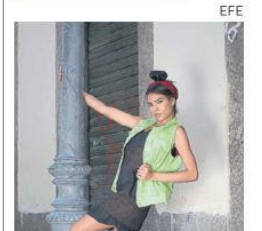
Destinos en Brasil.

CARTAGENA (EFE). La empresa GDx Travel ganó un concurso de la OMT y el Gobierno, por la consolidación de una plataforma de tiquetes aéreos de bajo costo.