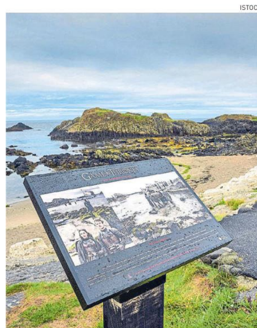
Varias locaciones de Irlanda están señalizadas para los turistas.

Reikiavik, Islandia, tiene paisajes únicos de glaciares y la naturaleza volcánica que representan la tierra al Norte del Muro y algunas escenas exteriores del Nido de Águilas, como se conoce en GOT. Un paquete que incluyen vuelo ida y regreso más alojamiento por 5 noches vale desde $6.713.830.