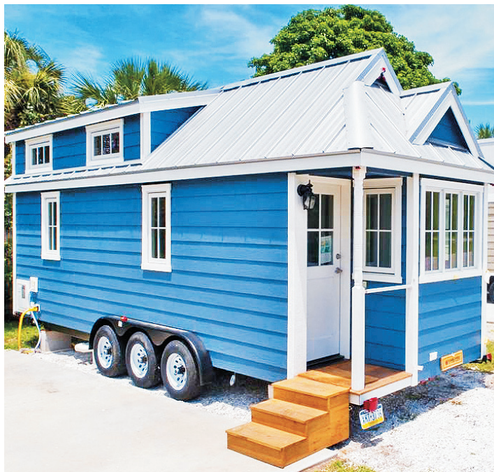
MINICASAS GENERALMENTE construidas en remolques son sencillas, relajadas y sustentables.

5 Apartamentos. El 33 % de los viajeros colombianos tienen pensado quedarse en un apartamento este año. Este tipo de alojamiento es uno de los que más rápido está creciendo según la plataforma digital mencionada. Un apartamento para las vacaciones es el equilibrio perfecto entre el escape de la rutina y la comodidad de un hogar.