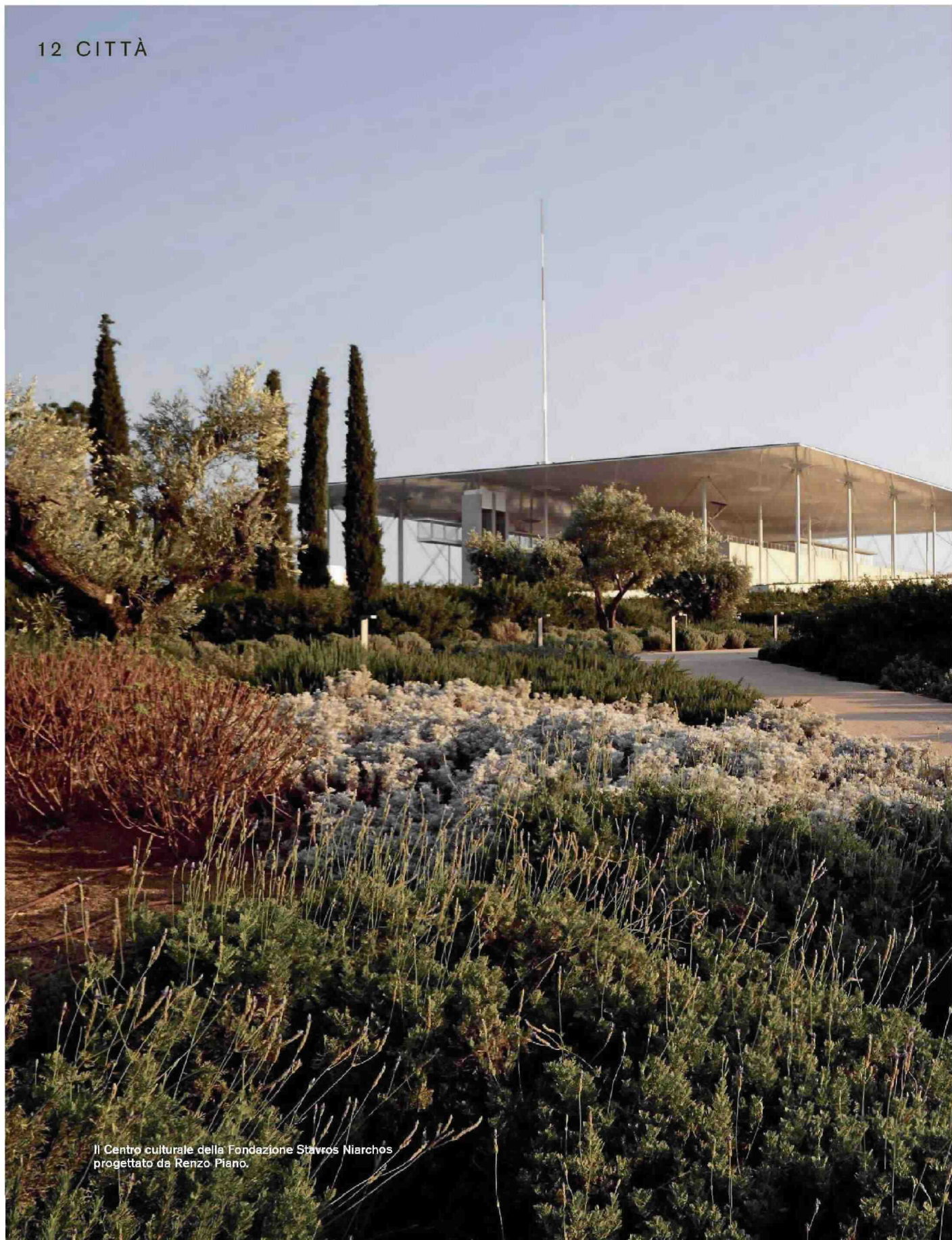
Il Centro culturale della Fondazione Stavros Niarchos progettato da Renzo Piano.