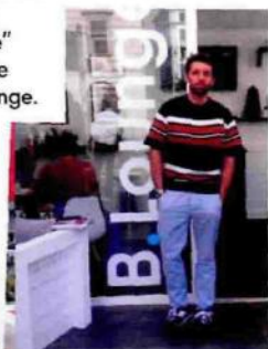
Massimo Giorgetti, direttore creativo di MSGM e Pucci.