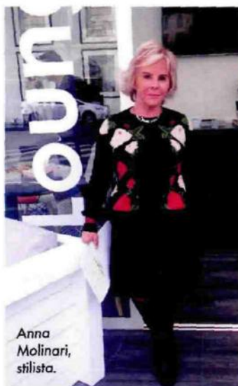
Anna Molinari, stilista.