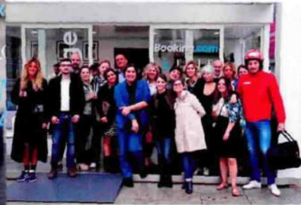
Family&Friends di Elle.it .