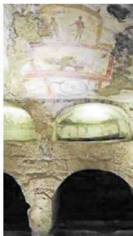
Le catacombe di San Gennaro a Napoli sono aperte dalle 20