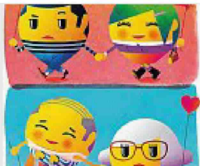
Verso settembre Una delle illustrazioni