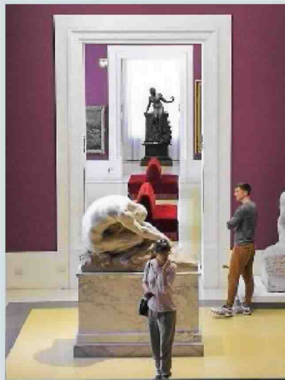
OLTRE L'ALBERGO C'È DI PIÙ Sopra, la Galleria Nazionale d'arte moderna a Roma. Sotto, il quartiere di Ginza a Tokyo e, a lato, il Cenacolo di Leonardo a Milano.

da poco ha lanciato il tool «Business Travel Ready», visibile solo agli utenti che accedono con la email aziendale. Per loro, circa 150.000 sistemazioni selezionate con criteri ad hoc: self check in, connessione wi-fi, rilevatori di fumo, ferro da stiro e courtesy kit.