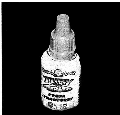
Fotografie č. 2