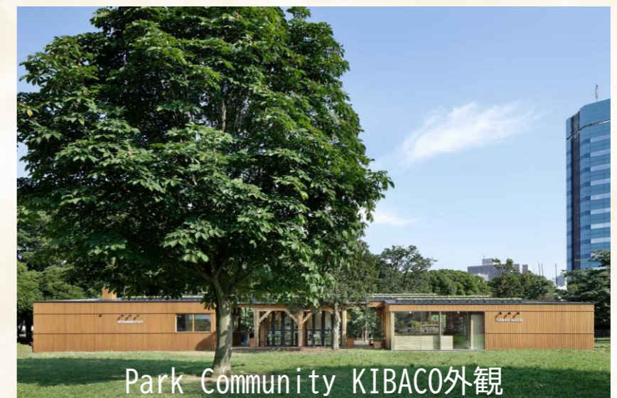
Park Community KIBACO外観