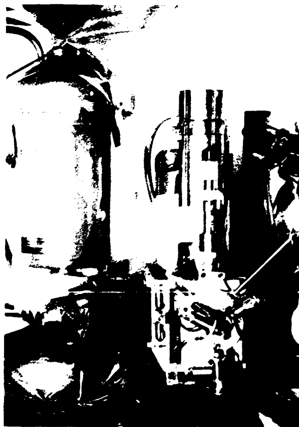
Figure 2 - MOTORISATION DE LA PLATINE