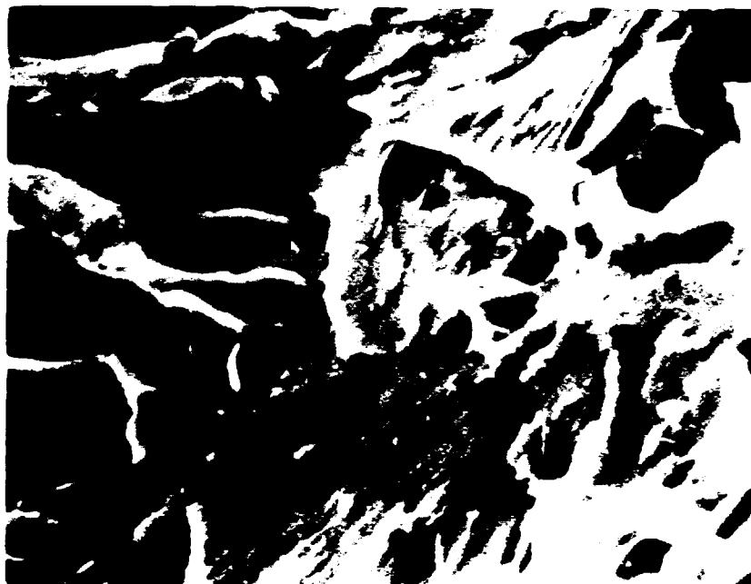
FRACTURE SANS SOURCE