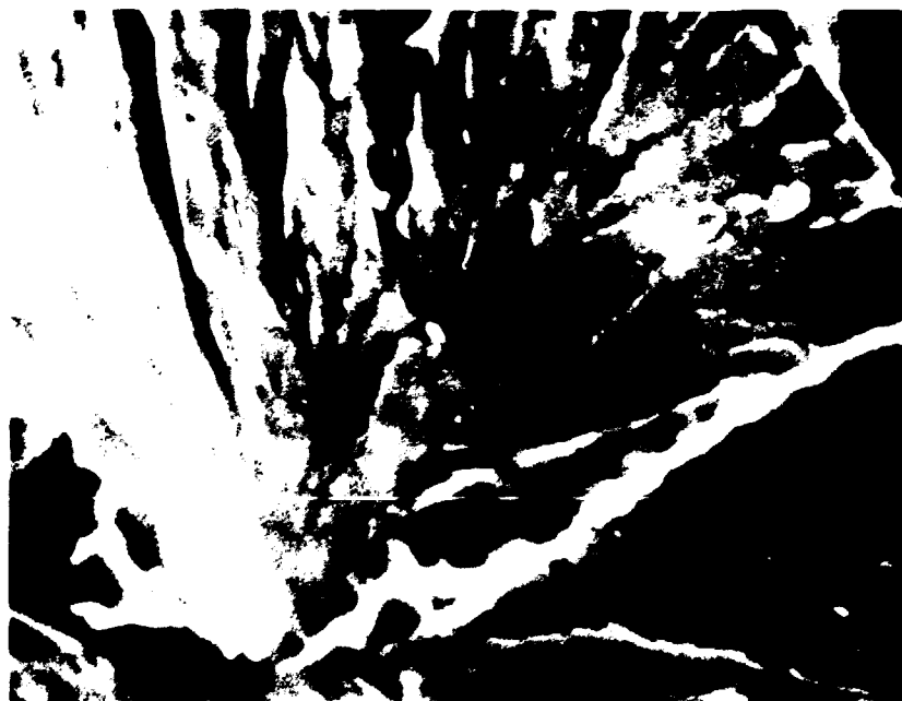
Figure 5 - FRACTURE AVEC SOURCE : 5 mCi