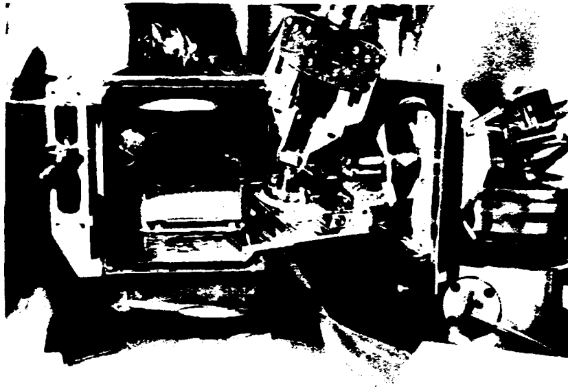
Figure 3 - SYSTEME DE FIXATION DU PORTE-ECHANTILLON