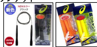
なわとび(大人用・子供用)