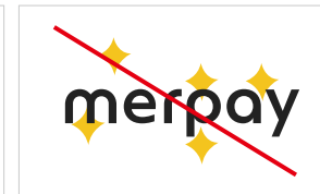
アイソレーション内での 他要素の表示