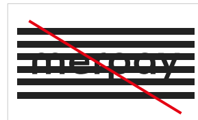
視認性を低下させる背景の使用