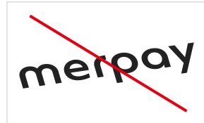
変形（長体・平体・斜体・回転）

株式会社メルペイが提供する全てのダウンロードデータは、データを変形・加工することはできません。右図のような使用は禁止します。