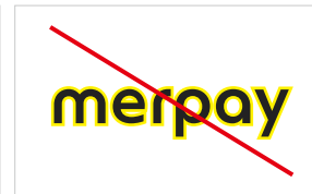
装飾（影・縁取り・立体表示）