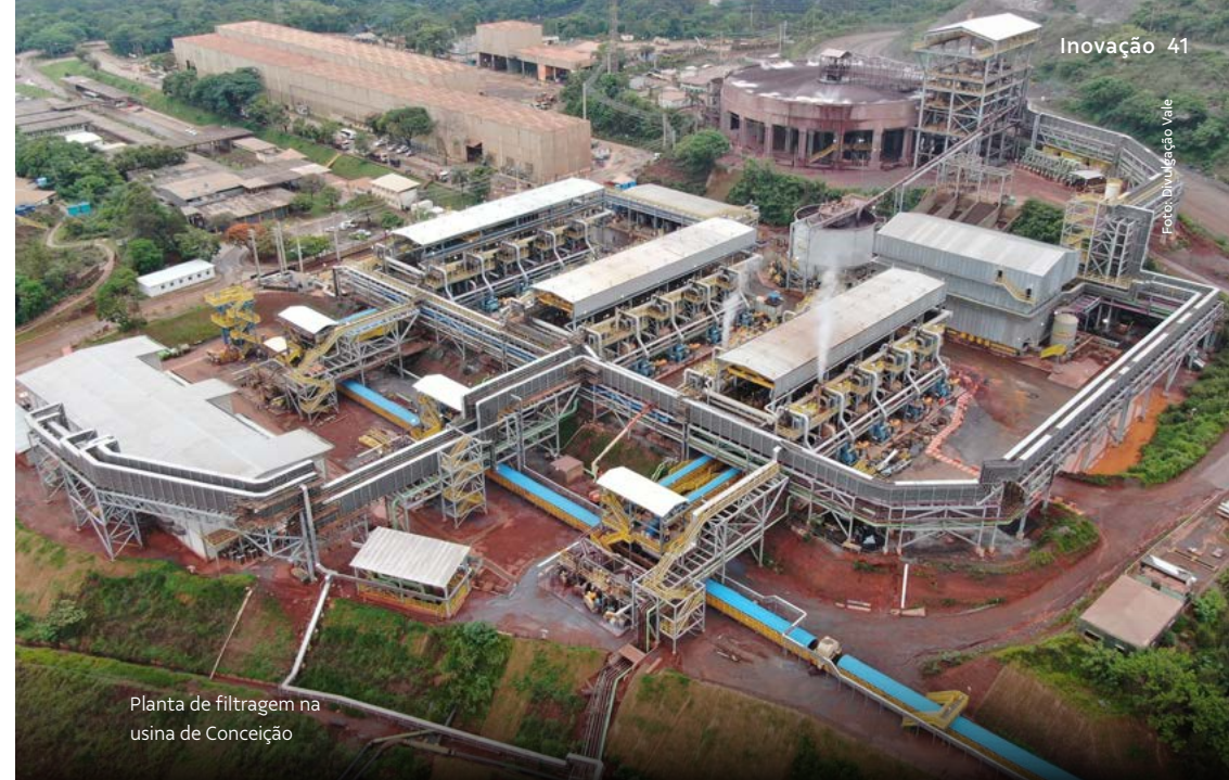
Planta de filtragem na usina de Conceição