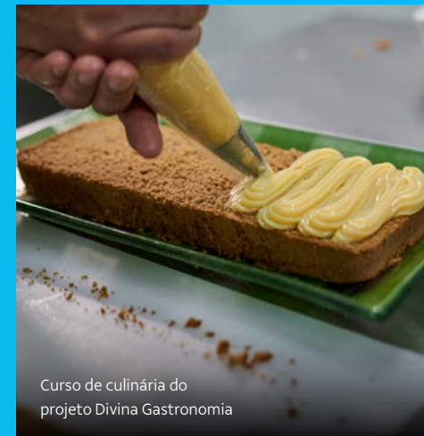
Curso de culinária do projeto Divina Gastronomia