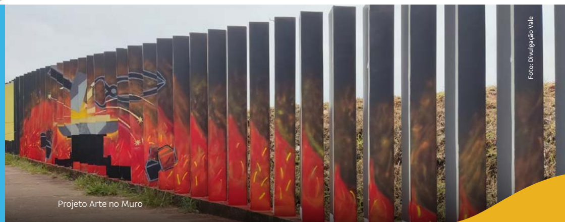
Projeto Arte no Muro

São imagens atuais de Itabira em contraste com os versos dedicados à cidade pelo ilustre itabirano. Há ainda painéis em homenagem ao Dia da Consciência Negra e o valor da diversidade, cultivada como princípio da sustentabilidade da Vale, e grafites que recordam as fundições nas imagens de crianças com brinquedos em ferro, como carrinho de rolimã, balanços, bicicletas e escorregador.