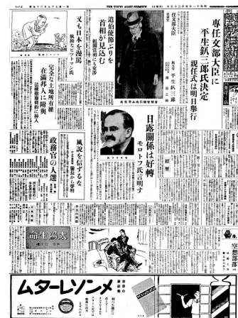
1936年(昭和11年)5月25日の紙面

こちらも2009年度は「聞蔵Ⅱ」で試験的な提供をしてきましたが、この度、オプションコンテンツとして正式にサービスを開始します。