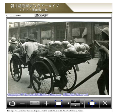
(拡大画像例:漢口の朝市)